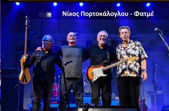
Νίκος Πορτοκάλογλου - Φατμέ