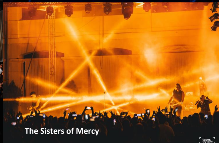
The Sisters of Mercy