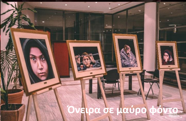
Όνειρα σε μαύρο φόντο

Η πρεμιέρα της θεατρικής παραγωγής του ΚΘΒΕ « Ταξίδι μιας μεγάλης μέρας μέσα στη νύχτα » φιλοξενήθηκε στο Φεστιβάλ τον Ιούλιο και επαναλήφθηκε τον Σεπτέμβριο και το Φεστιβάλ ολοκληρώθηκε την 1η Οκτωβρίου με την θεατρική παράσταση « Ένεκα Zeneca ».