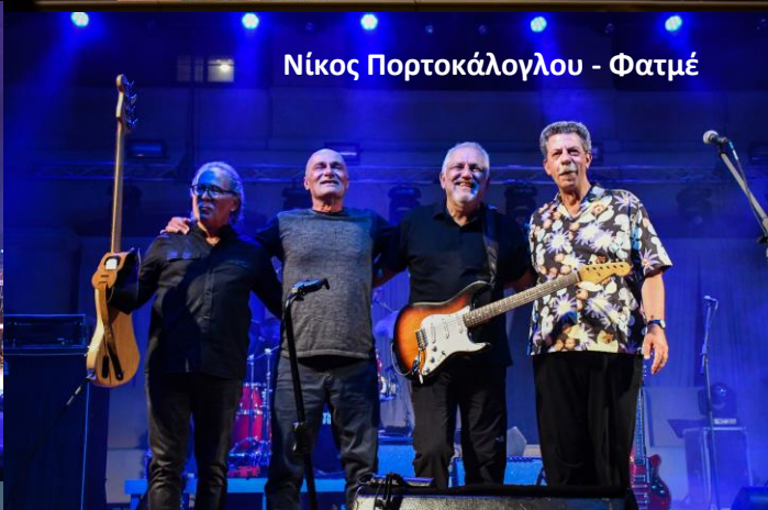
Νίκος Πορτοκάλογλου - Φατμέ