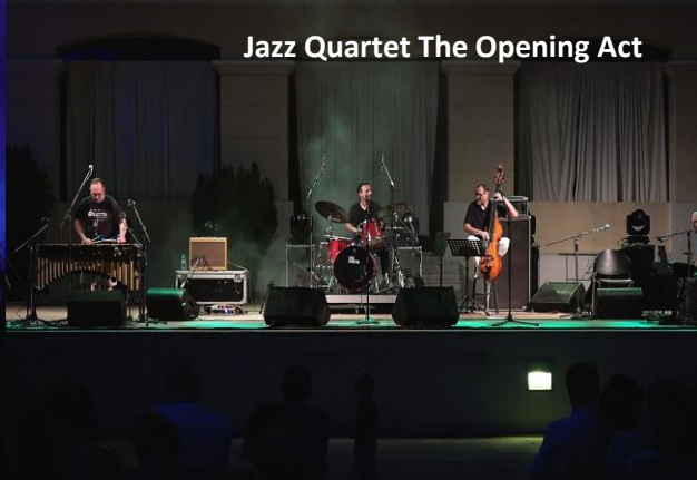
Jazz Quartet The Opening Act