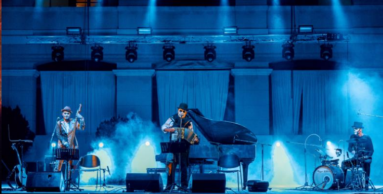
The Tiger Lillies