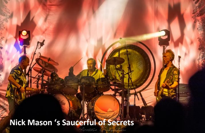
Nick Mason 's Saucerful of Secrets