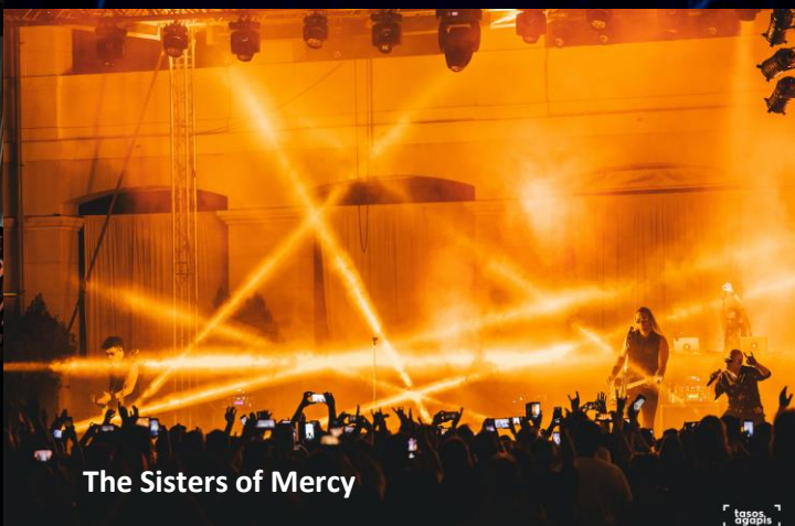
The Sisters of Mercy