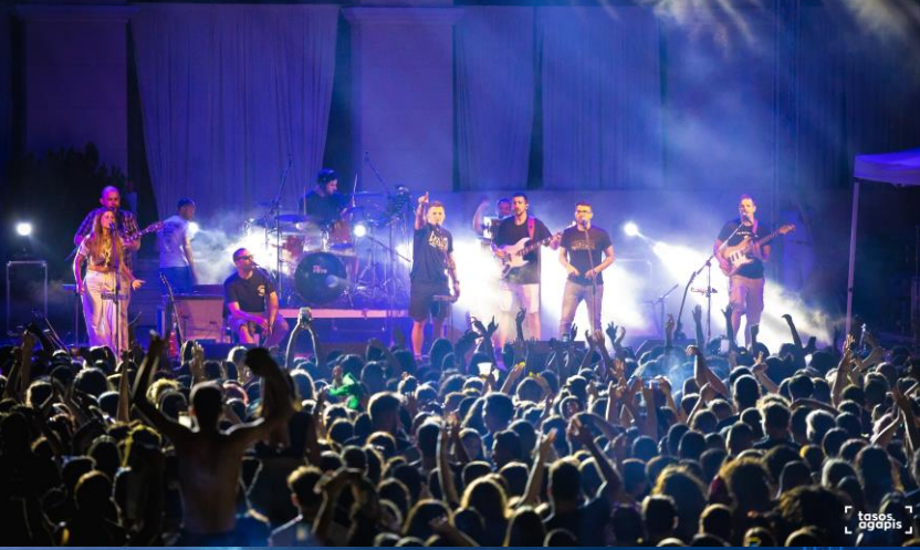
Εισβολέας - Χατζηφραγκέτα