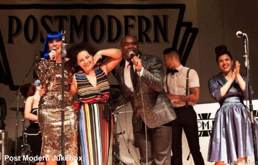
Post Modern Jukebox