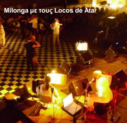
Milonga με τους Locos de Atar