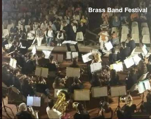
Brass Band Festival