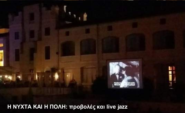
Η ΝΥΧΤΑ ΚΑΙ Η ΠΟΛΗ: προβολές και live jazz