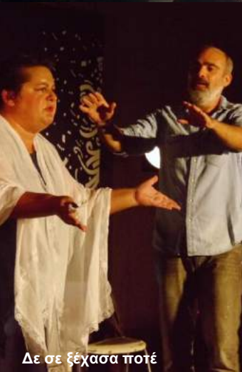
Δε σε ξέχασα ποτέ