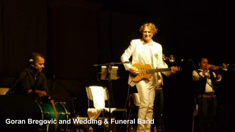
Goran Bregović and Wedding & Funeral Band