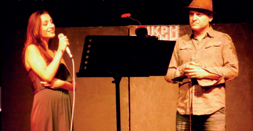
Τρεις Τύποι για Γέλια και για Κλάμματα | Η-Art Attack