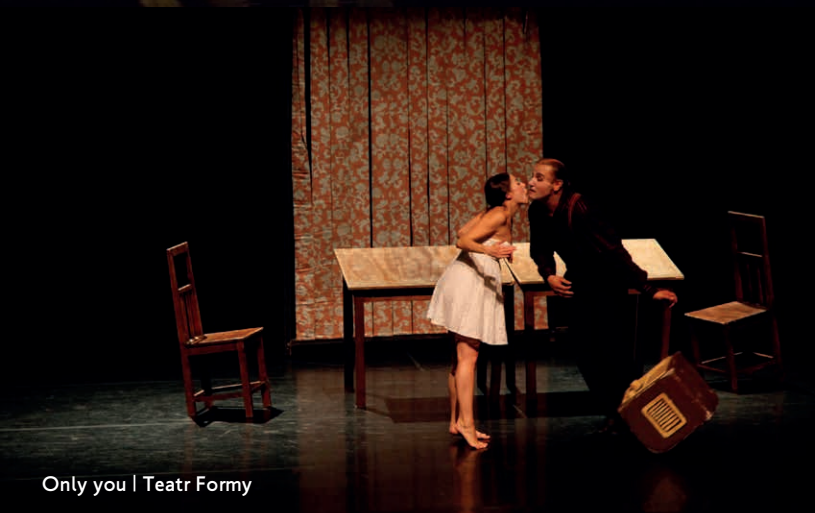
Only you | Teatr Formy