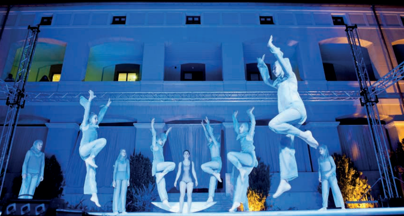
Ελληνική Σχολή Κουγκ Φου Κοσμικών Αποστόλων Σαολίν Θεσσαλονίκης