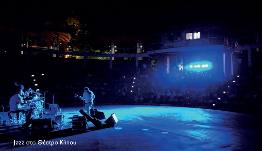
Jazz στο Θέατρο Κήπου