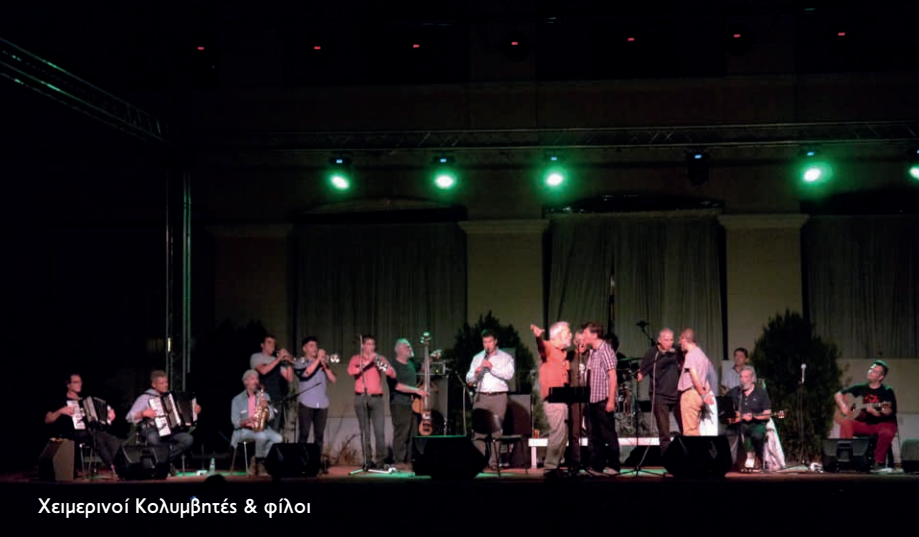
Χειμερινοί Κολυμβητές &amp; φίλοι