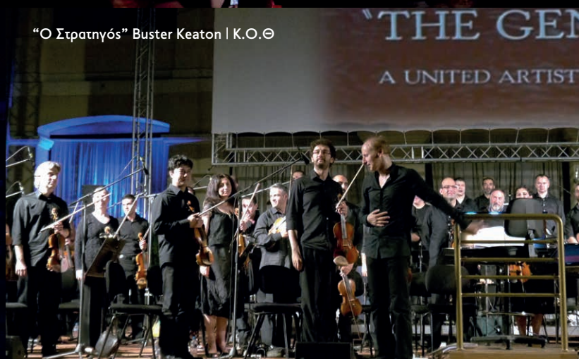
“Ο Στρατηγός” Buster Keaton | Κ.Ο.Θ