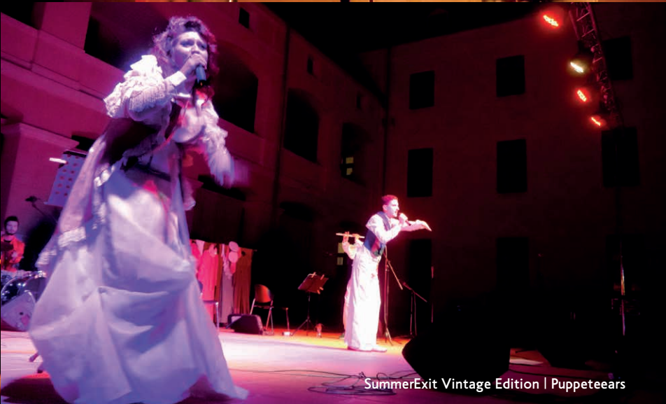
SummerExit Vintage Edition | Puppetears