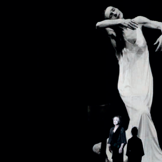
Ikiru. Αφιέρωμα στην Pina Bausch/Tadashi Endo