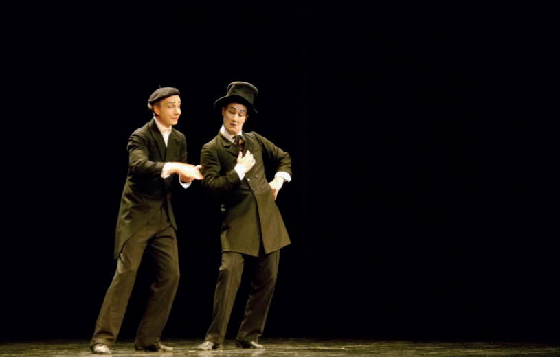
Déjà-vu? | Bodecker & Neander Company