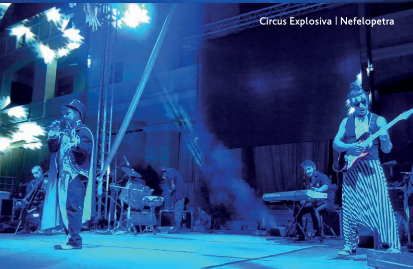
Circus Explosiva | Nefelopetra