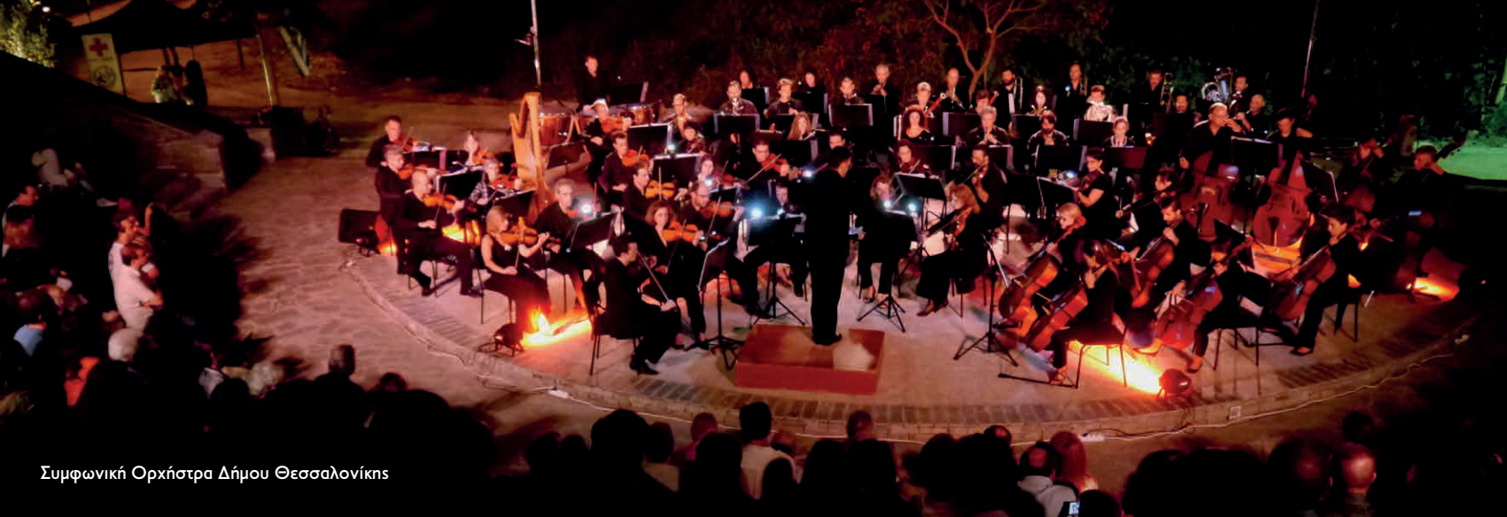
Συμφωνική Ορχήστρα Δήμου Θεσσαλονίκης